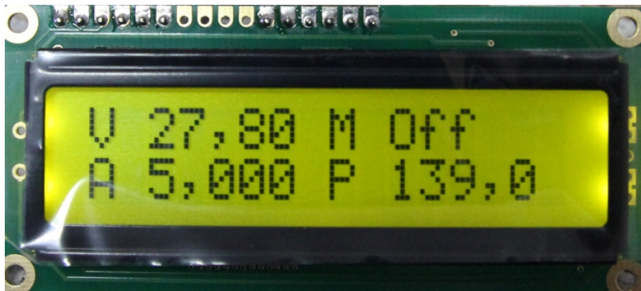
Рисунок 1 - LCD 1602 со служебной информацией

При использовании LCD 1602 имеется четыре виртуальных дисплея: